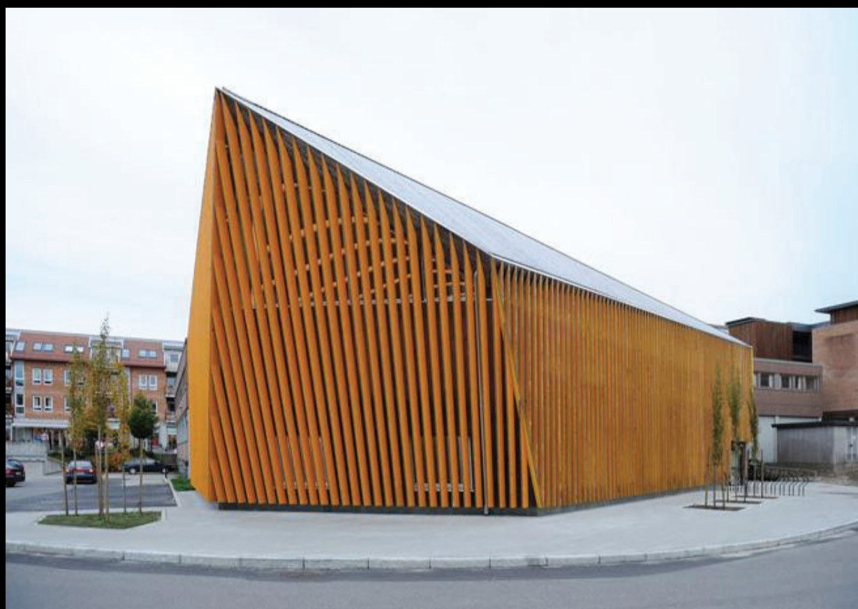
Vennesla Library and Cultural Centre